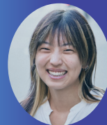
協力 (一社) OSAKAあかるクラブ